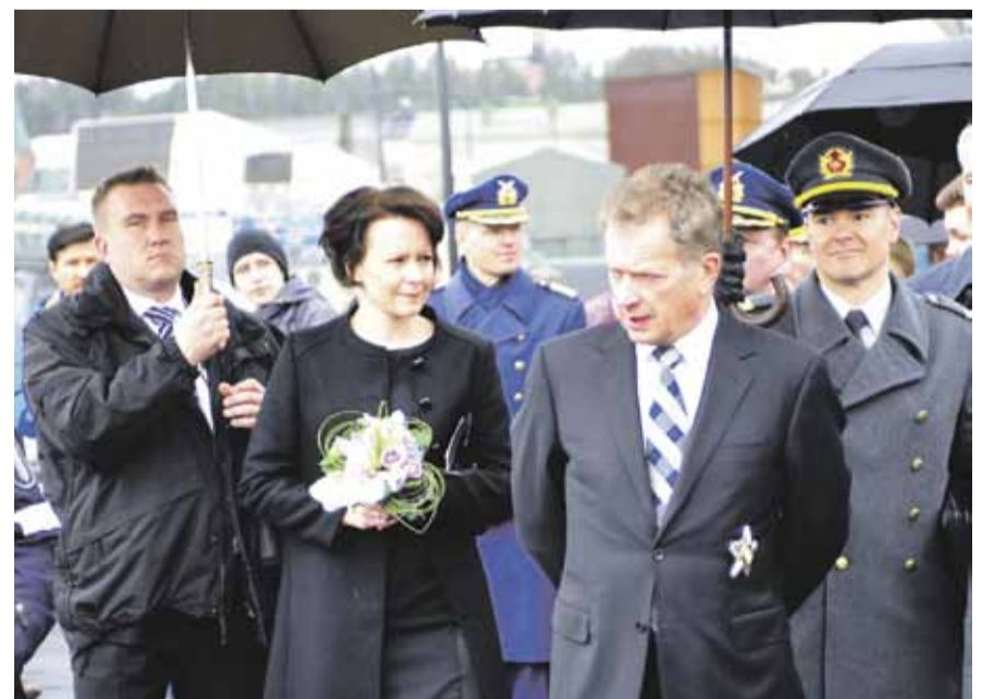
Teksti ja kuvat: Tapio Paappanen

Järjestelyjen osalta kaikki olivat tyytyväisiä. Tapahtumaan osallistuneet osasivat askeleensa.