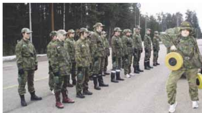
Kevät-Hallissa naiset saivat tuntumaa svarusmiespalvelukseen.

Kurssipalautteessa eniten toivottiin kurssin olevan kolmipäiväinen, johon voisi sisältyä majoitus kasarmilla ja aamutoimien kokeminen. Fyysiset rasitukset eivät pe-