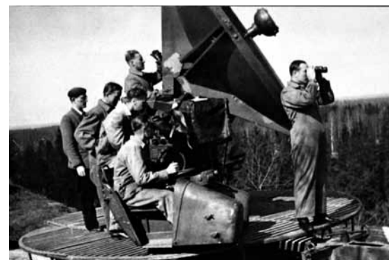
Irja-tutkat olivat sodan jälkeen koulutuskäytössä Suomessa aina 1950-luvulle saakka.