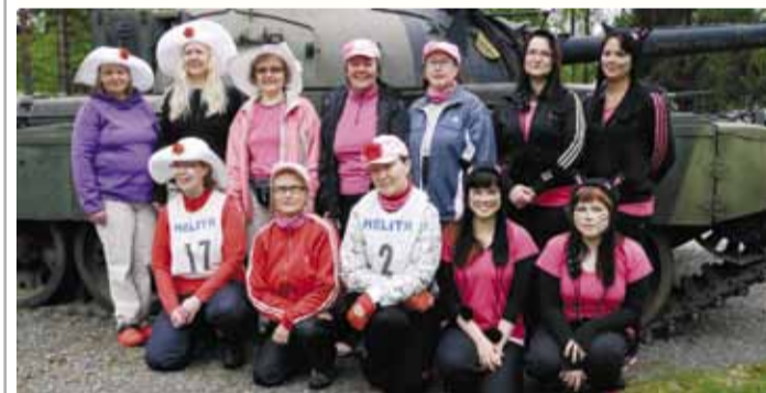
Hattu-jotoksen yksi tehtävä oli tehdä joukkueelle oma hattu.

Parolan Panssariprikaati ja Hattulan alue tarjosi oivalliset puitteet 24. maanpuolustusnaisien jotokseen. Hattu-jotoksessa kisaisi 44 joukkuetta. Keski-Suomesta tapahtumaan osallistui neljä joukkuetta. Reitit olivat vaihtelevia polveilun Hattulan harjuilla ja männikkökankailla, sekä panssariprikaatin ja kunnan keskustan