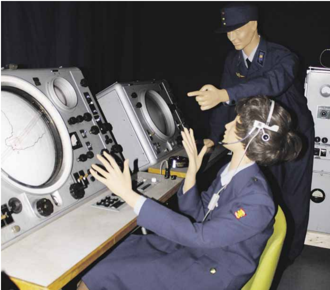
VRRVY-tutkan valvontakeskuksen näyttölaitteet.