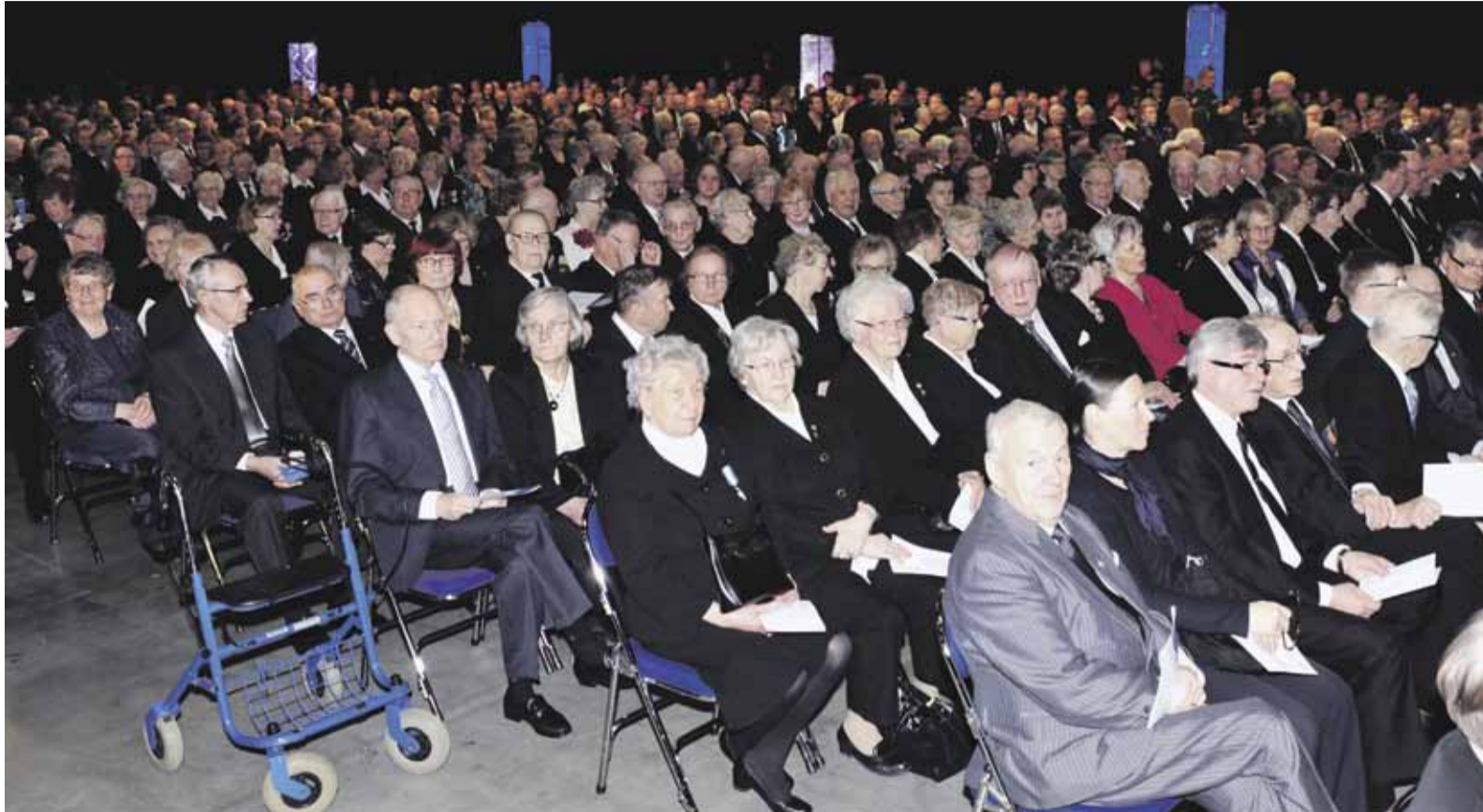
Kansallisen veteraanipäivän juhlayleisöä Jyväskylän Paviljongissa.