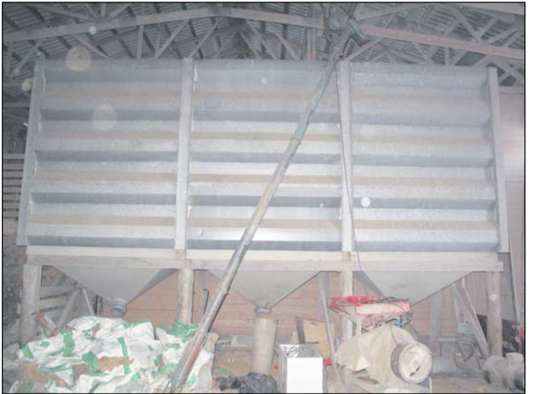
Viljaa on tällä erää runsaasti varastoituna maatilatalouksissa.

Kuljetusalalla tärkeintä on merikuljetusten sekä elintarvike- ja energiahuollon kuljetusten turvaaminen. Merikuljetuksissa vain vajaa kolmannes tahtuu enää kotimaisella tonnissa-