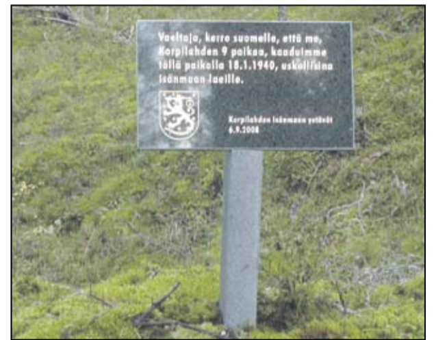
Korpilahden Isänmaan ystävät ovat pystyttäneet muistolaatan tuhoutuneen korsun kohdalle. Piirien sotahistoriallisella retkellä käydä hiljentymässä paikalla.