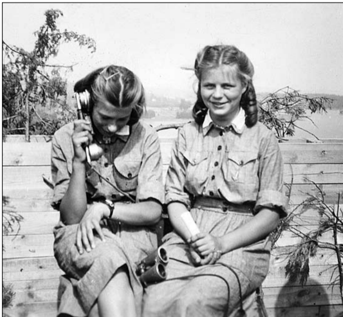
Noin 18-vuotiaat neitokset Porriuvuoren ilmailuvuorintornissa Luhangassa.

Vaatetus- ja jalkinetilanne huononi sota-aikana nopeasti. Vaatteiden ahkera huoltaminen oli välttämätöntä. Kun uutta kangasta ei saatu, valmisvaatteista puhumattakaan, korjattiin vanhoja. Niitä parsittiin ja paikattiin, ratkottiin ja ommeltiin uudestaan. Villaisista purkulangoista neulottiin rintamalle sotilaskintaita, sukkaa ja muuta lämmintä. Nahkaisista sormikkaista saatiin paikkaustarpeita kengänpäälisiin. Jopa armeijan harmaista flanelista jalkarateista tehtiin