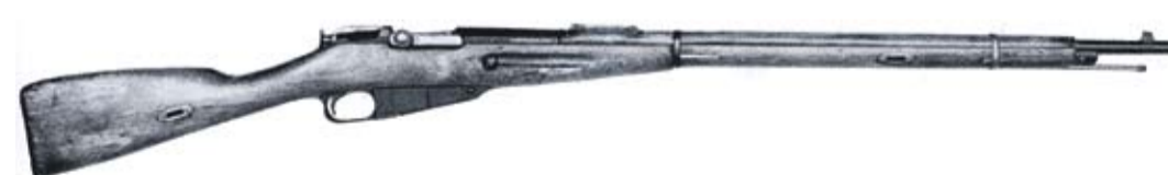
Kasakkakivääri m 1891 Ishevsk 1904 nro 186.

Toimikunta kokoontui vielä muutaman kerran pohtimaan ratkaisua ja 16.4.1891 hyväksyttiin valmistettavaksi aseeseen, johon otettiin Nagantista kolme