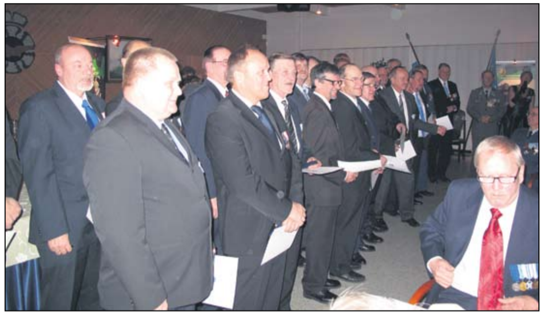
Nobel-ristin rintaansa saaneiden rauhanturvaajien rivistö.

Ensi vuonna juhlistamme jälleen YK:n päivää illallistans-