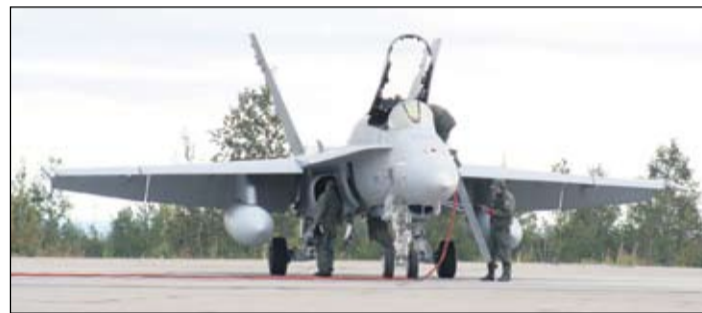
Huoltomiehet Hornetin kimpussa.

sen myötä. Supistukset tapahtuvat eläkkeelle jäämisten myötä.