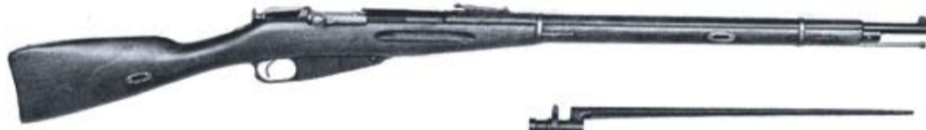
Rakuunakivääri m 1891 Ishevsk 1895 nro 174176.

tua konstruktioita. Ainakin kahdesta versiosta valmistettiin koeaseet, jotka ovat nykyään nähtävissä Sotamuseossa Helsingissä. Aseiden menestyksestä kokeissa ei ole tarkempia tietoja, mutta josta se, että suomalaisen asesuunnittelijan aseita oli mukana valittaessa Venäjän armeijan palveluskivääriä, on osoitus suomalaisen asesuunnittelun erinomaisuus-