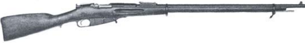
Jalkaväen kivääri m 1891 Siestarjoki 1893 nro 6643.