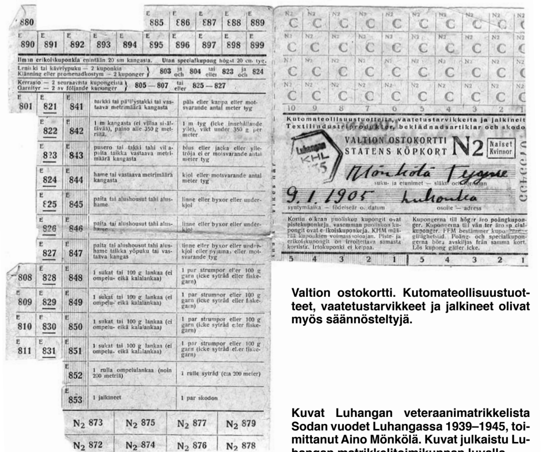
Valtion ostokortti. Kutomateollisuustuotteet, vaatetustarvikkeet ja jalkineet olivat myös säännöstelyä.

Erittäin vaikeaan tilanteeseen jouduttiin siellä, missä mies kaatui taistelutantereella. Sotaleski lapsineen jäi omin voimin selviytymään. Lasten tähden täytyi jaksaa, vaikka töihin kuuluivat pellon muokkaukset ja kylvyt, sadonkorjuu, karjanhoito sekä polttopuun hakkuut ja ajot. Työ oli leskelle tarpeellista. Silloin tultiin myös naapureista apuun. Suomalainen perinteinen tapa suoriutua töistä työvoiman puuttuessa on ollut talkoot. Ne nousivat arvoon arvaamattomaan. Talkoita järjestettiin kylillä niin naapureiden kuin erityi-