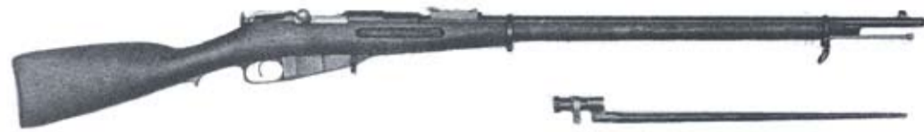
Jalkaväen kivääri m 1891 Chatellerault 1893 nro 21584.