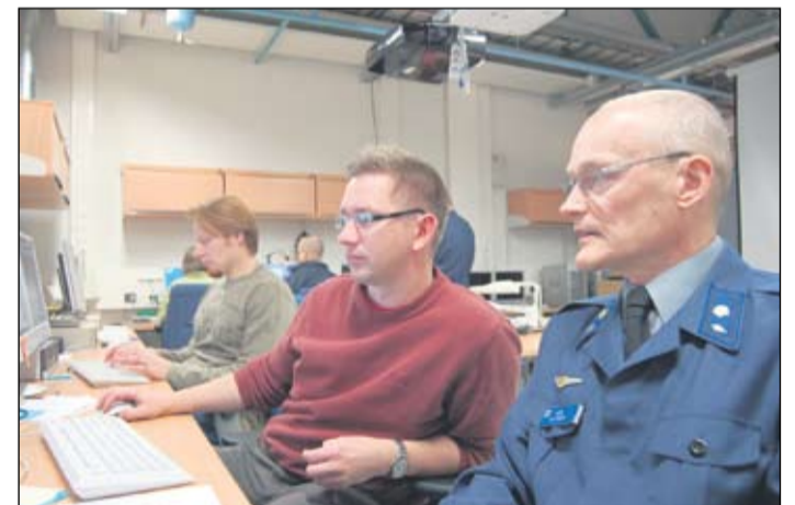
Kaksi kolmasosaa siviilejä, yksi kolmasosa sotilashenkilöitä.

Ilmavoimien Viestivarikko on perustettu kahteen kertaan. Ensimmäisen kerran se perustettiin 1.12.1941 ja toisen kerran tasan 50 vuotta myöhemmin. Varikko lakkautettiin sodan jälkeen Puolustusvoimien palatessa sotaa edeltävään organisaatioon. Ilmavoimien Varikon viestivarikko-osasto siirtyi Tampereelta Tikkakoskelle vuonna 1973, jolloin aloitettiin suunnitella viestivarikon uudelleen perustamiseksi. 1980-luvulla varikkoa kehitettiin systemaattisesti vastaamaan Ilmavoimien maaelektronikan kunnossapidosta ja järjestelmien käyttöönottoista.