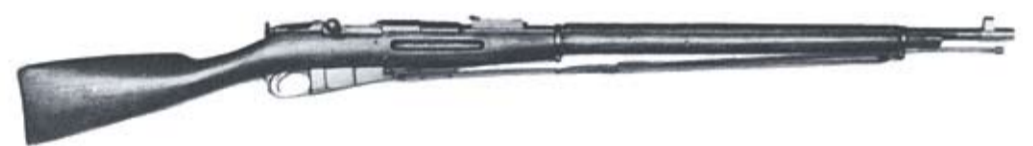
Jalkaväen kivääri m 1891 Siestarjoki 1896 nro 17960.