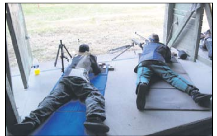
17.5. se sitten taas alkaa!