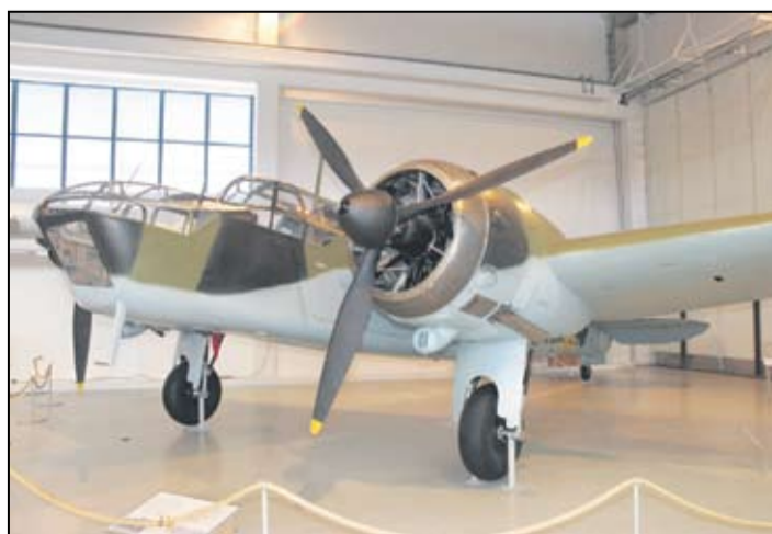
Blenheim seisoo taas ylväänä Keski-Suomen Ilmailumuseossa.