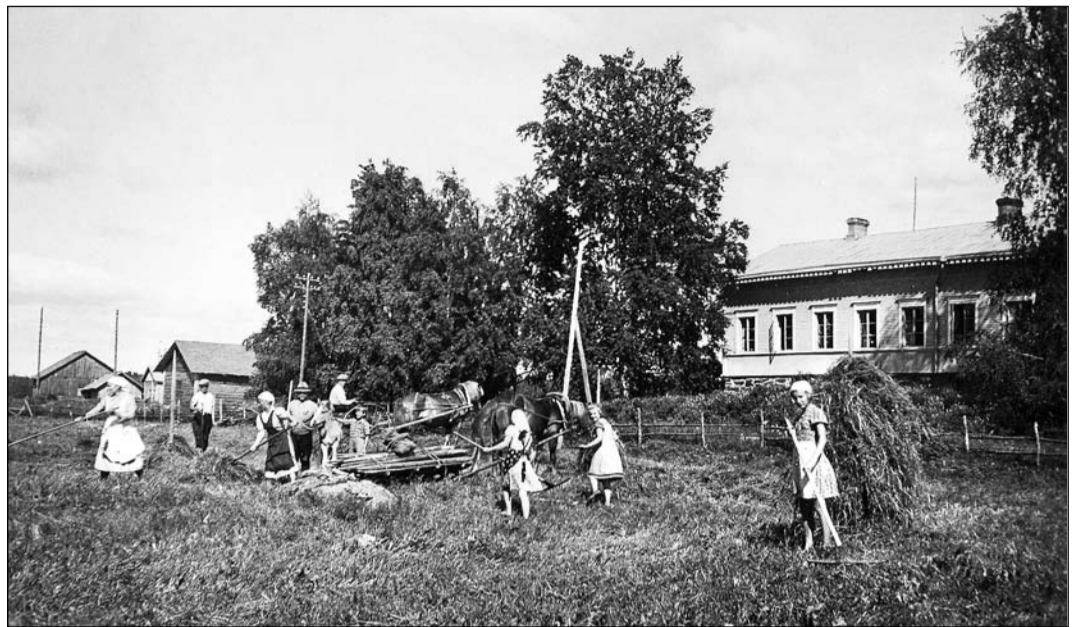
Nuoret ja naiset olivat pääasiallisena työvoimana Mäkelän heinäpellolla Luhangassa kesällä 1942.

Sota-ajan perheenemännät, kotirintamaiset, olivat kekseliäitä valmistessaan niukoista