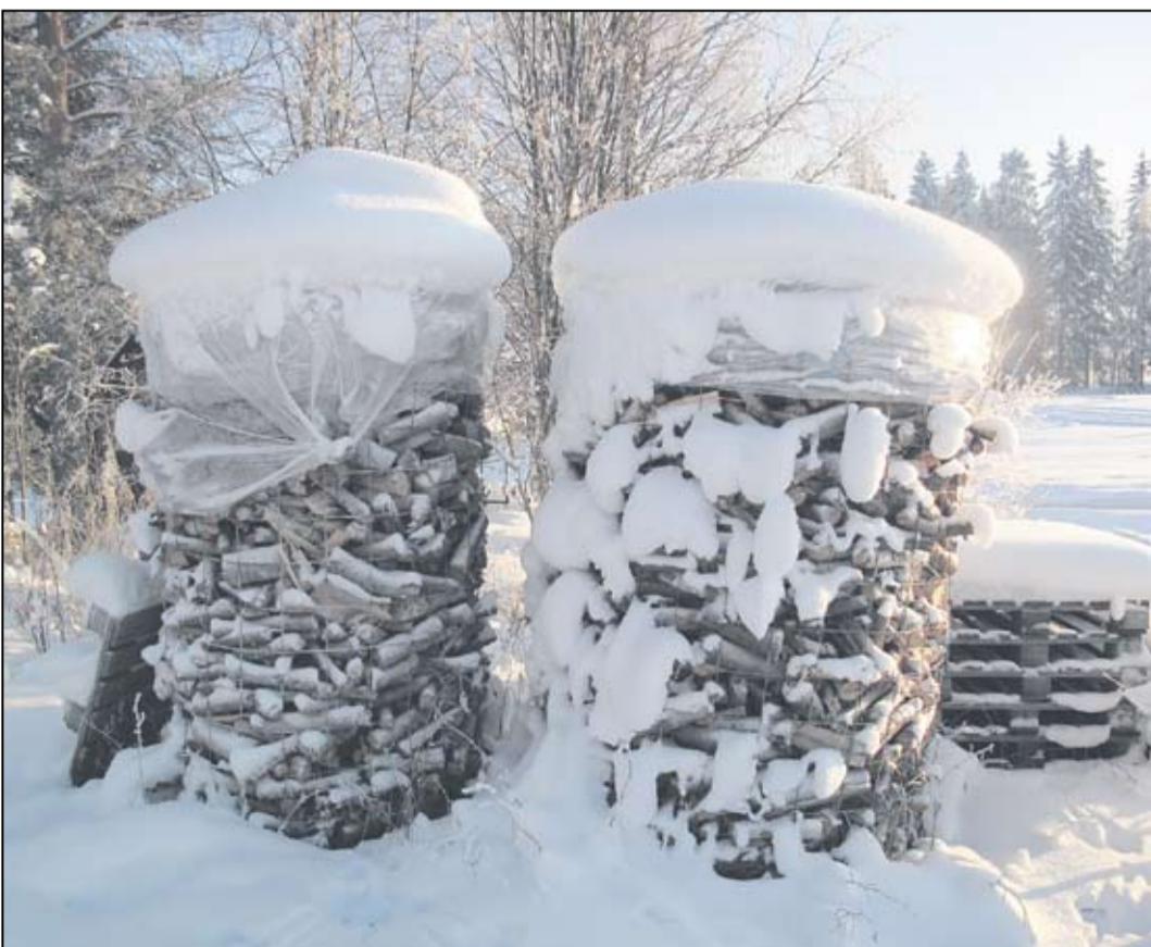
Monella tilalla maaseudulla on polttopuuta pitkäksikin ajaksi.