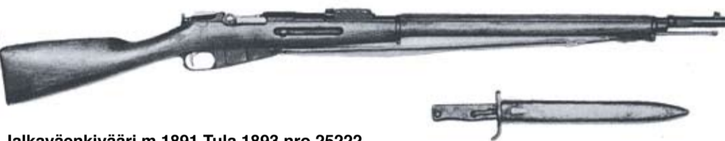
Jalkaväen kivääri m 1891 Tula 1893 nro 25222. Piipun suuhun lisätty myöhemmin Saksassa pistimen kiinnitysholkki (Ersatz-pistin).